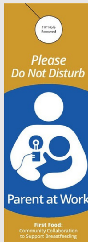
El frente del colgador de puerta