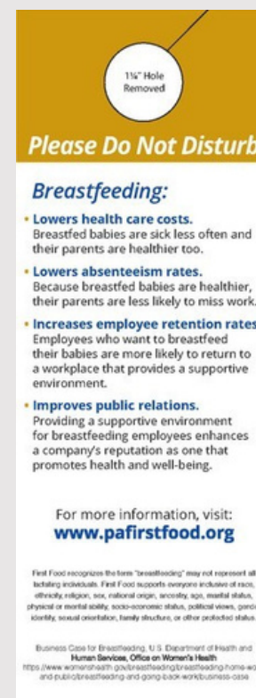
La parte atrás del colgador de puerta

Para ordenar, por favor env íe un mensaje a breastfeeding@paaap.org